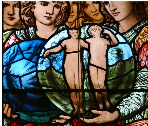
Oxford, Harris Manchester College. Les vitraux de la chapelle.