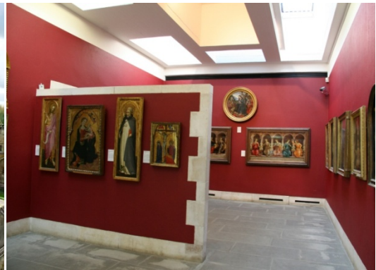
Christ Church Picture Gallery