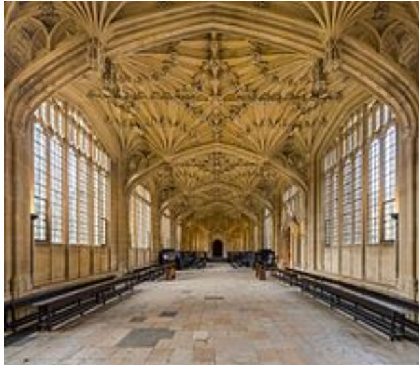
Bodleian Library, Divinity School

Le rendez-vous suivant est à Christ Church College, sans aucun doute le plus grand collège de l'Université.