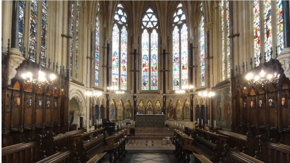
Oxford, Exeter College, la chapelle