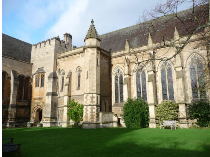
Oxford, Harris Manchester College