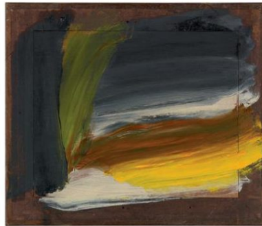
HOWARD HODGKIN TIME AND PLACE 2001-2010