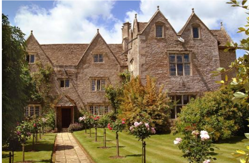
Kelmscott Manor, les jardins