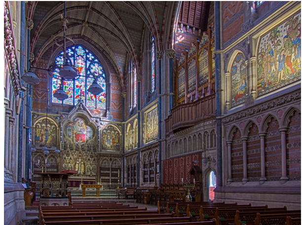
Oxford, Keble College. Les vitraux et les mosaïques