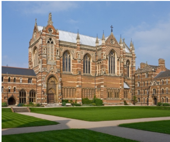
Oxford, Keble College

commanditaire en 1873. Une version postérieure de cette peinture se trouve à la Cathédrale Saint Paul à Londres.