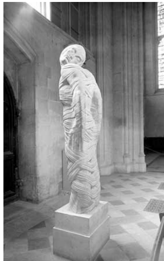
Oxford, New College, la Chapelle avec la statue de Jacob Epstein, Lazare