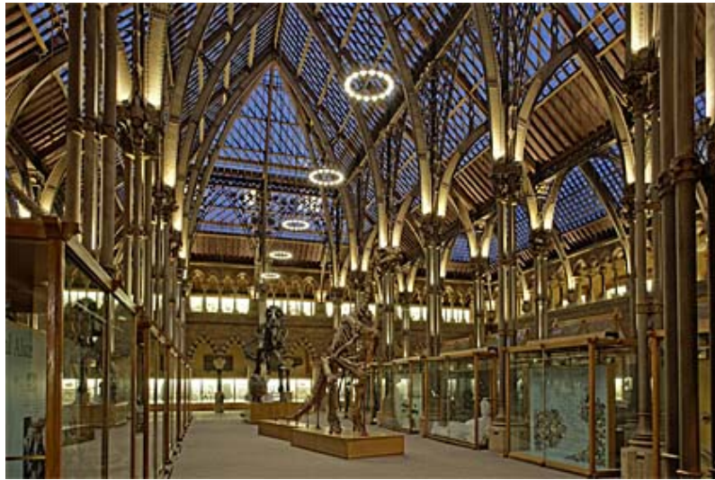
Musée de l'Histoire des Sciences

part tant pour l'histoire des sciences, que pour les collections elles-mêmes et le développement de la culture occidentale.