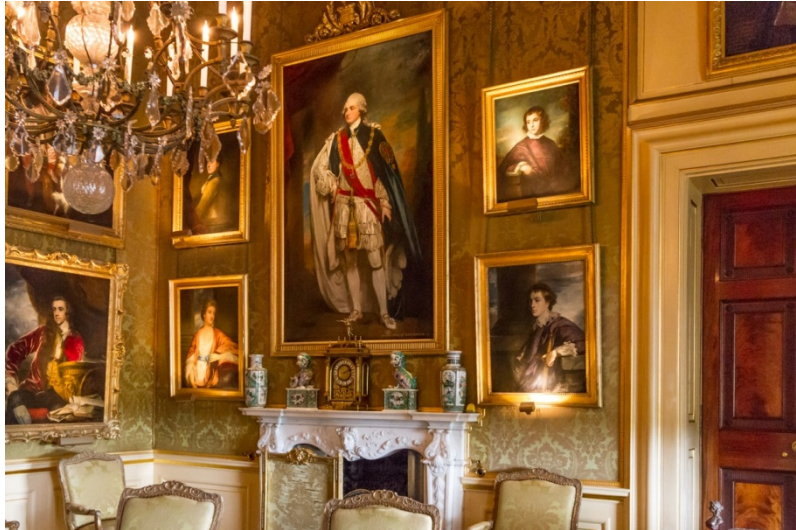
Blenheim Palace. Collection de peintures