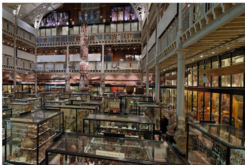
The Pitt-Rivers Museum