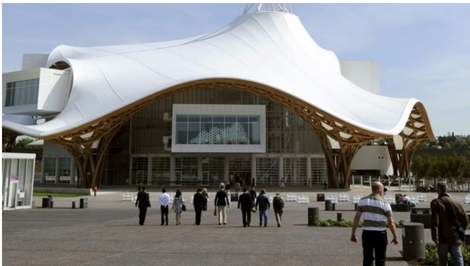
Centre Pompidou, Metz

Le Centre de Pompidou de Metz (France) est donné en exemple comme expérience de décentralisation culturelle.