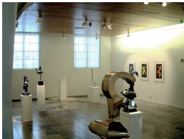
Rétrospective Kari Huhtamo

La ville de Rovaniemi est la capitale de la Laponie finlandaise. Le Rovaniemi Art Museum a pris place dans le bâtiment rénové de la Maison de la Culture Korundi ouvert au printemps 2011. Autrefois dépôt des fourgons postaux, la Maison Korundi accueille aussi l'orchestre de chambre de Laponie. Le mot « Korundi » vient du nom d'un minéral dont les plus beaux exemplaires ont été trouvés en Laponie, le Corundum , parfois appelé « Étoiles de Laponie ».