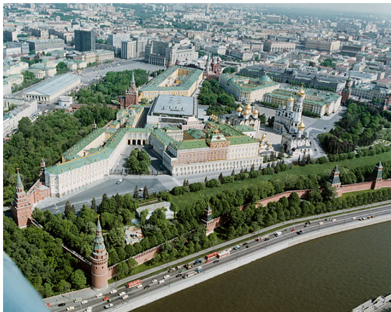
Vue aérienne du Kremlin

Cette journée était consacrée à l'histoire et à l'art de la Russie. Chacun attendait avec impatience la visite du Kremlin, de ses églises et de ses Trésors.