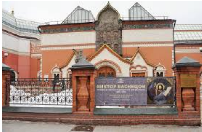
Entrée de la Galerie Tretyakov

Lyubov présente le quiz mis en place par la Galerie Tretyakov et disponible dans l'espace d'exposition et sur le site web de la Galerie. Il sert de guide d'exposition, permet de connaître les visiteurs et de soutenir leur attention à l'aide de questions. A l'issue de la visite, les questionnaires sont déposés et un jury sélectionne les bonnes réponses. Leurs auteurs sont ensuite tirés au sort et un prix est remis aux gagnants qui expliquent le rôle joué par le musée dans leur vie.