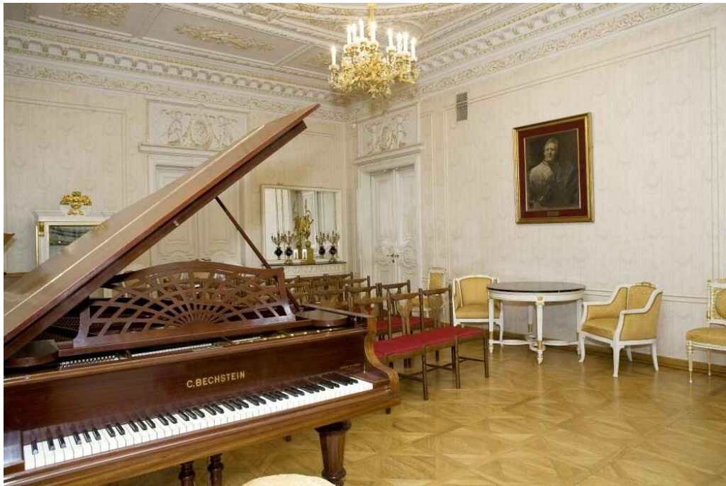
The Fyodor Shalyapin Memorial Estate. Salon de Musique

20.00 –22.00: Thé de bienvenue. Concert de musique de Chambre au Fyodor Shalyapin Memorial Estate