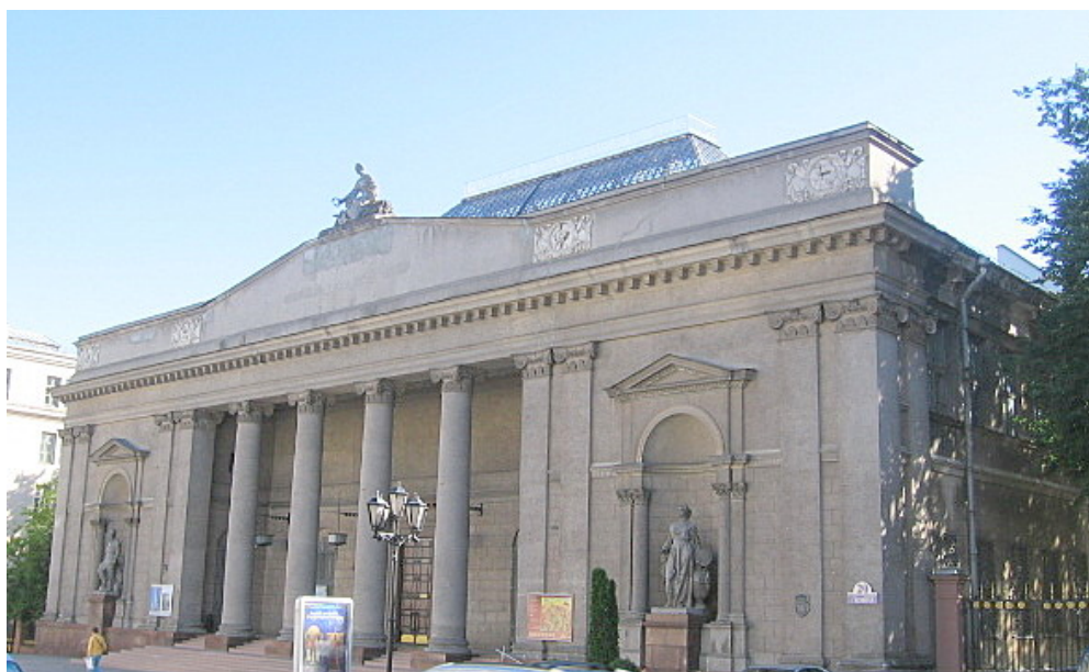
Minsk, Musée national de Biélorussie

Un programme d'investissement débutant en 2013 devrait faire de cet ensemble de bâtiments un seul complexe muséographique. Ceci permettra d'accroître les surfaces d'expositions. Il sera doté d'équipements techniques adaptés, d'une cafeteria et de boutiques, devenant ainsi le centre historique et culturel de la ville.