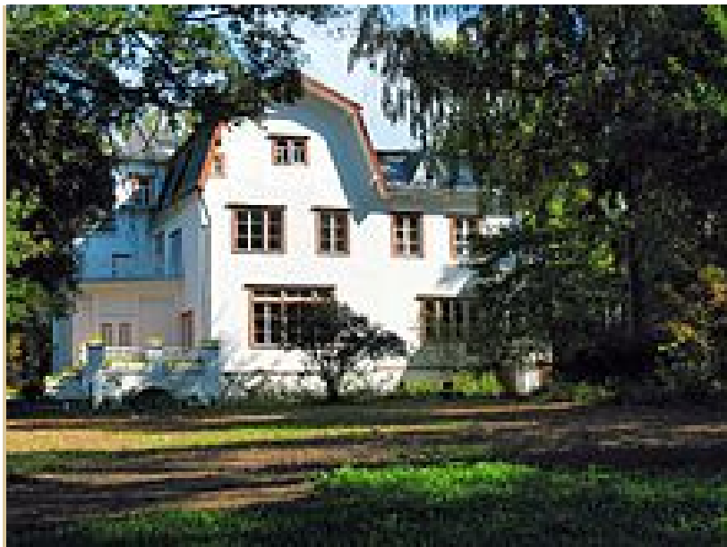
Polenovo, Musée Vassili Polenov

Nous quittons Moscou pour visiter, sous la conduite de la descendante de l'artiste, Natalia Polenova, le Musée-mémorial des arts et d'histoire et réserve naturelle Vassily Dmitrievitch Polenov dédié à l'artiste russe Vassily Dmitrievich Polenov (1844-1927). Cette maison-musée, située à 100 km au sud de Moscou près de la rivière Oka est achevée en 1892. La famille Polenov s'y installe; l'artiste aménage un atelier dans les étages supérieurs. De grandes ouvertures permettent de bénéficier du paysage et de la vue sur la rivière Oka et sur Taroussa. Né dans une famille d'artistes humanistes, Vassili Polenov, dont la mère est une célèbre portraitiste de l'Ecole de Brullov, passe son enfance à Saint-Pétersbourg. Désirant se consacrer à la peinture, il entre à l'Académie des Beaux-Arts et voyage à travers l'Europe, notamment en France.