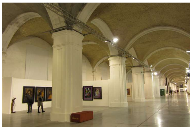
Kiev, Arsenal Mystetskyi

L'Arsenal Mystetskyi est le projet ukrainien le plus ambitieux depuis 1991 ; on veut créer un centre culturel, artistique et muséographique à Kiev. Bâtiment de l'ancien arsenal construit entre 1783 et 1801 dans l'ancienne forteresse Pechersk, il est resté aux mains des militaires jusqu'au début de notre siècle. En décembre 2000, un décret du Président de l'Ukraine ordonne sa remise en état.