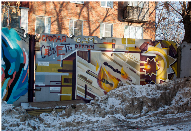
Grafs à Keremovo

La seconde étape de ce projet était « Je change la ville ». Il s'agissait d'un projet éducatif auquel ont participé des graffeurs de Keremovo. Une école de graf mise en place dans le musée a permis à ces jeunes de créer leurs propres œuvres d'art dans les rues de la ville et ainsi d'en changer la physionomie.