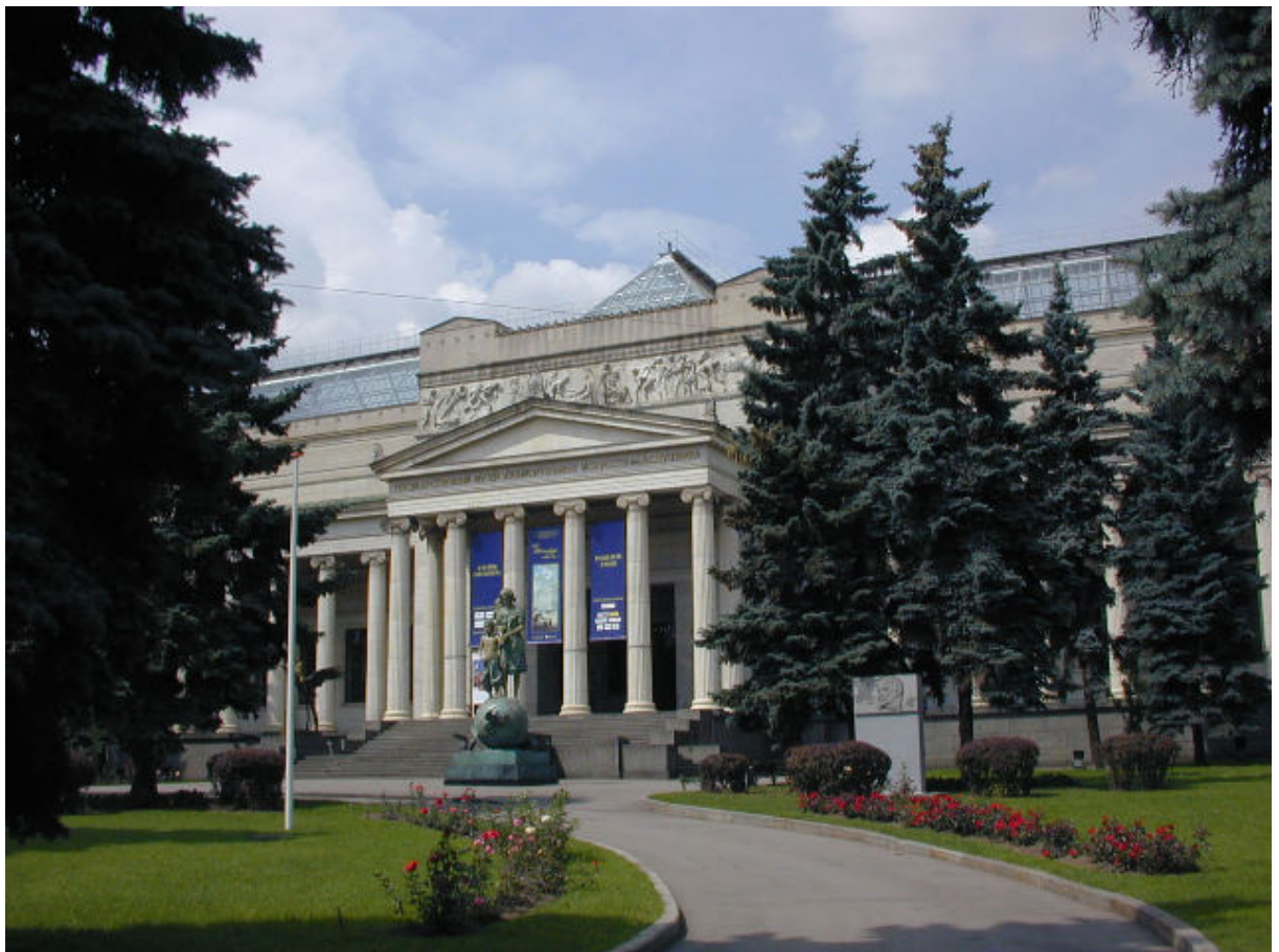
Musée des Beaux-Arts Pouchkine

MUSEES DES BEAUX-ARTS DANS UN MONDE CHANGEANT: DIVERSITE ET COMPLEXITE