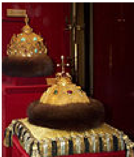
Bonnet de Vladimir Monomaque

Poursuivant notre périple autour de la Place Rouge, nous nous rendons au Musée Historique d'Etat (State Historical Museum), le plus grand musée du genre en Russie avec plus de 5 millions d'objets. Les plus grands artistes russes, tels Viktor Vasnetsov, Ilia Répine ont participé à sa décoration glorifiant les hauts faits de la Russie.